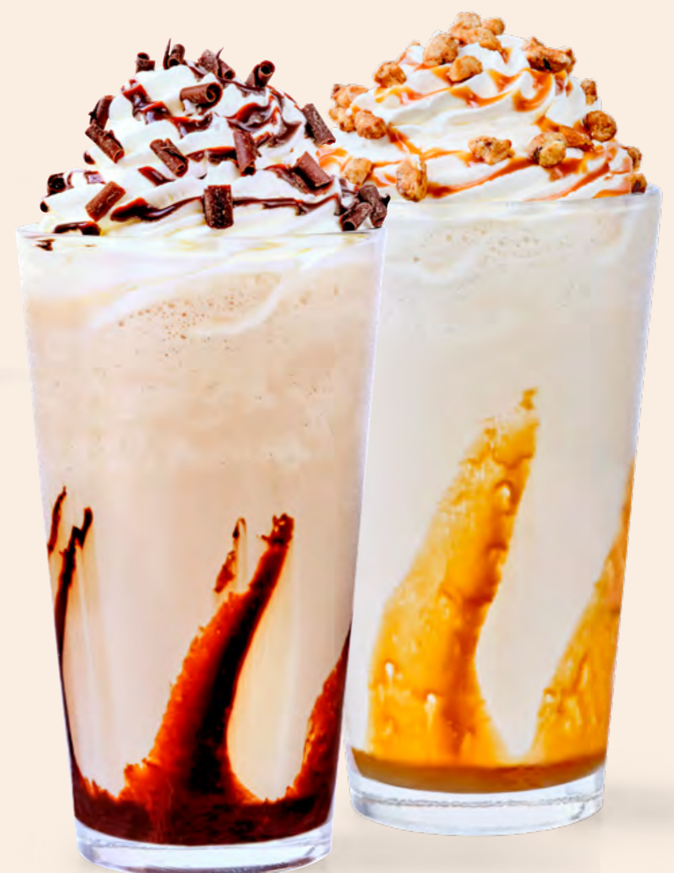
CAPPUCCINOS FREEZE Regular S/18 Caramel y Mocha S/21