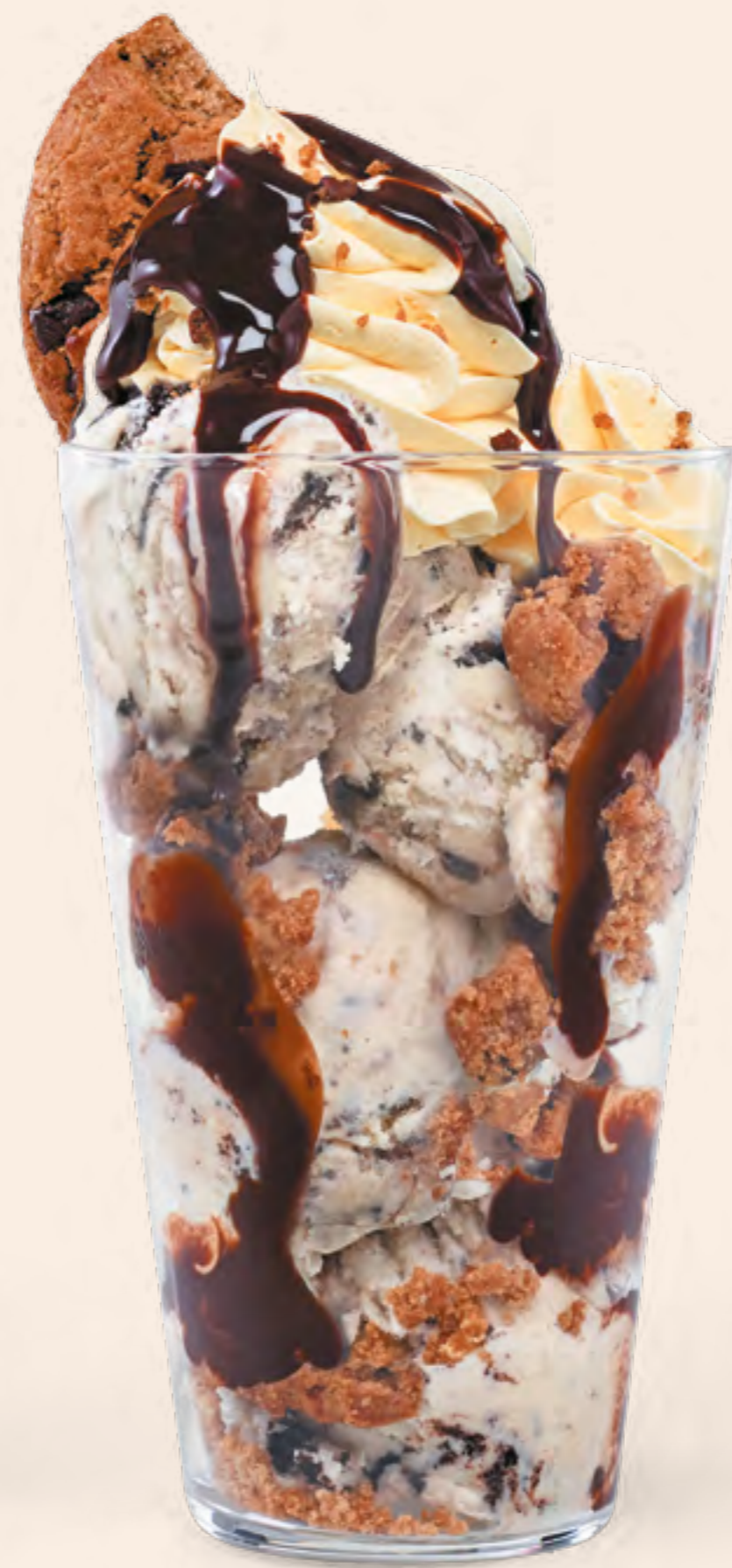
COOKIE CRUNCH Clásico: S/27 Mini: S/21