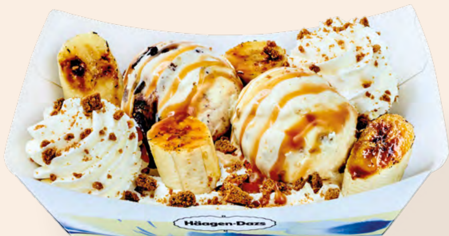
BANANA SUPER SPLIT S/27