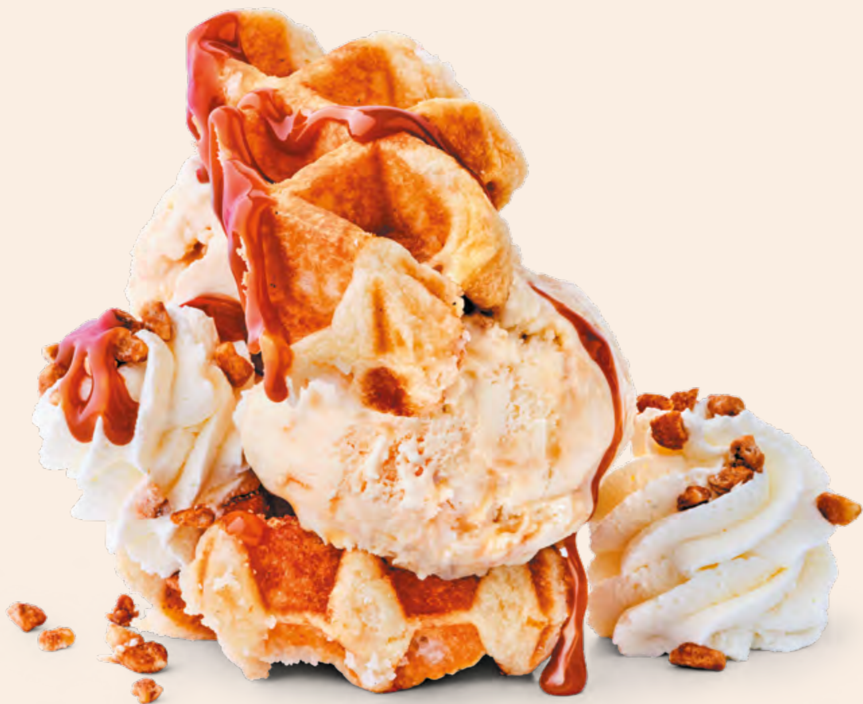
CARAMEL BELGIAN WAFFLE S/27