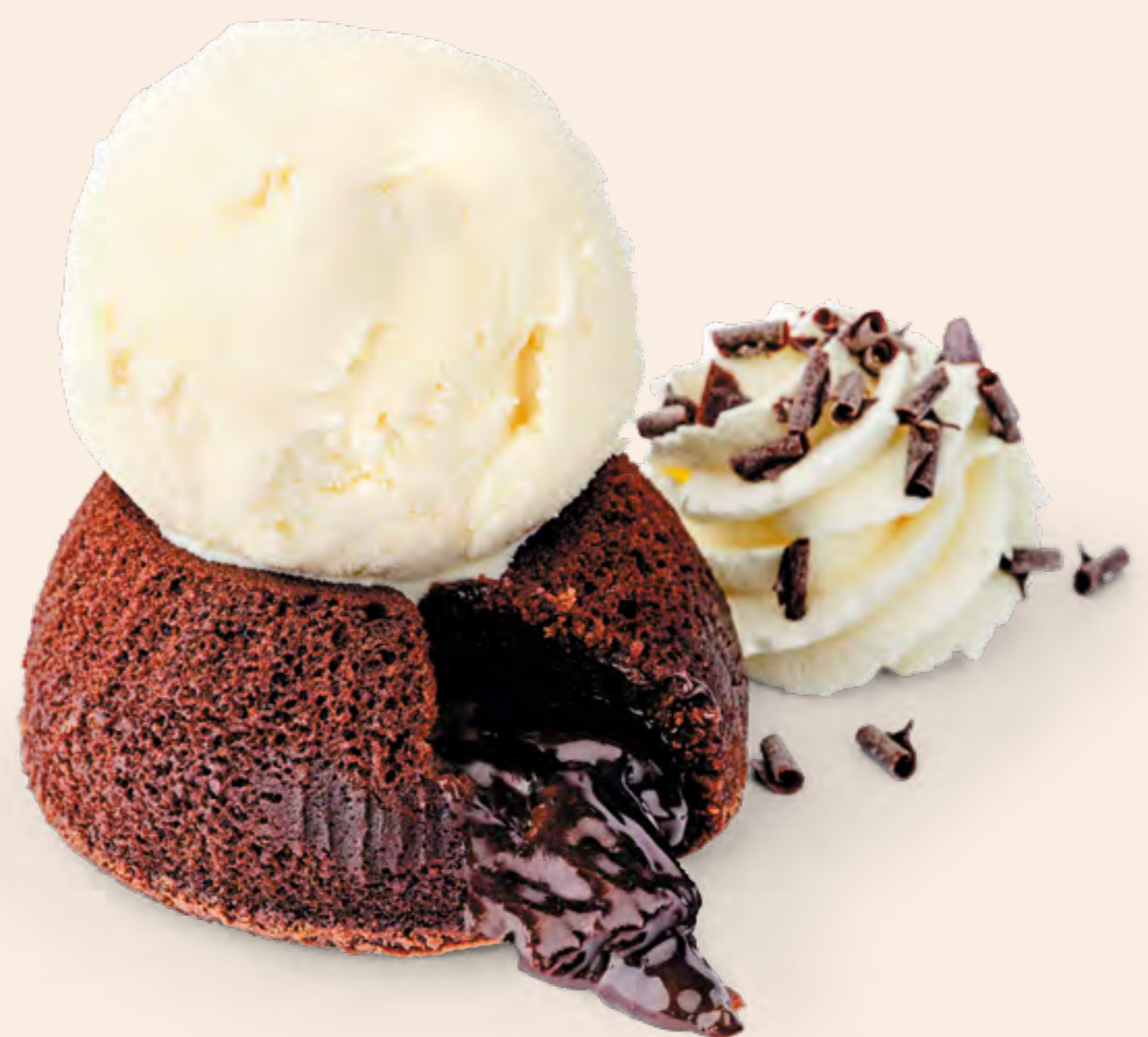
MOLTEN LAVA CAKE S/23