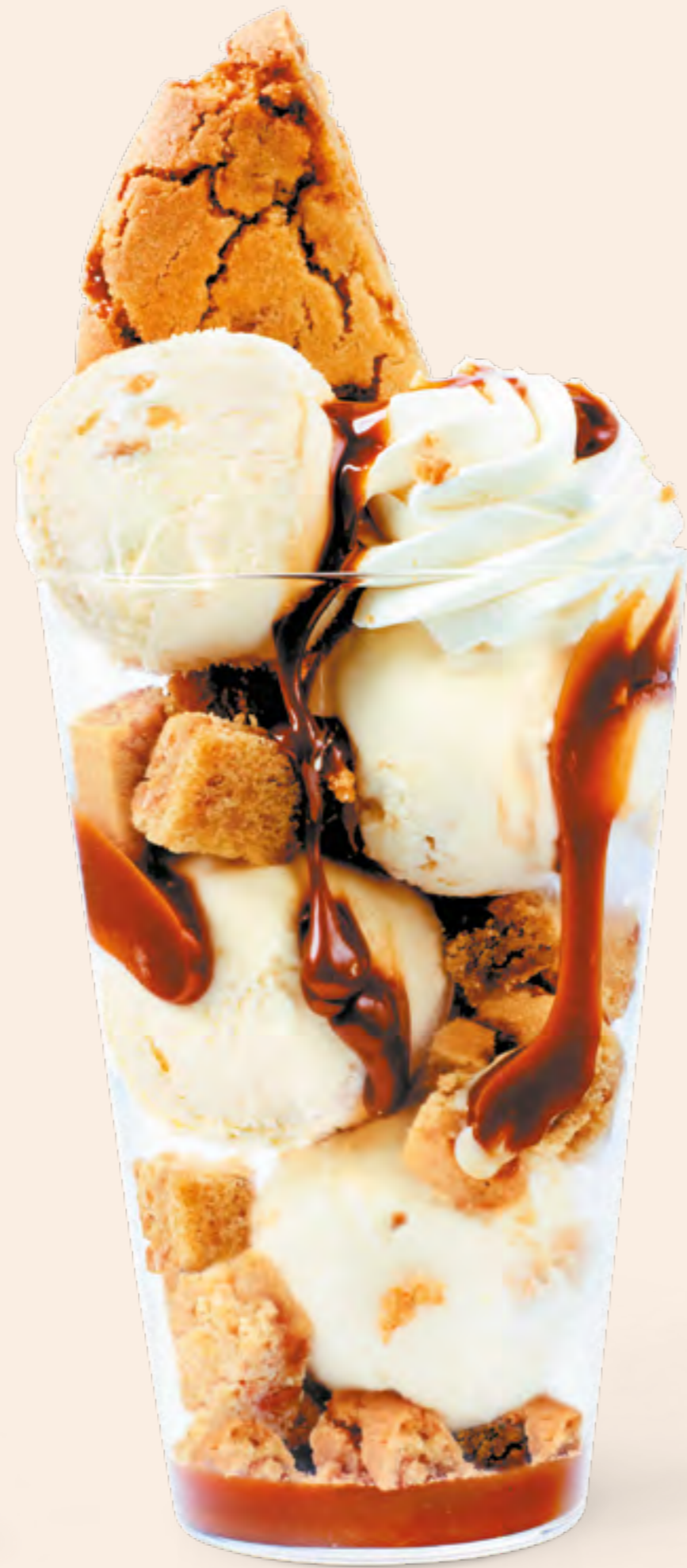
MACADAMIA CRUNCH Clásico: S/27 Mini: S/21