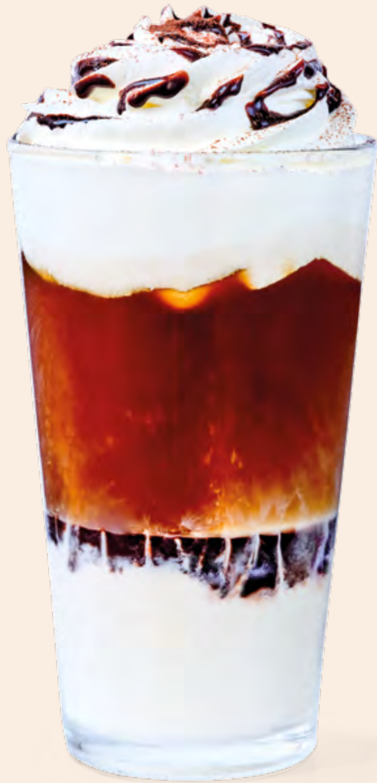
ICED COFFEE S/23