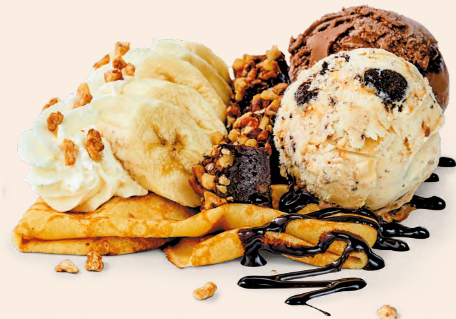
BANANA CHOCOLATE CREPE S/27